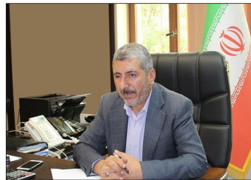
مدیرکل امور مالیاتی استان کرمان اظهار داشت: بر اساس اعلام سازمان امور مالیاتی کشور امکان مشاهده اطلاعات سامانه مودیان در اظهارنامه پیش

وی افزود: مودیان می‌توانند از مسیر ورود به سامانه مودیان بخش اظهارنامه پیش فرض در کارپوشه اختصاصی خود نسبت به مشاهده آن اقدام کنند. مدیرکل امور مالیاتی استان کرمان تصریح کرد: نظر به اینکه مهلت ثبت صورتحساب‌های الکترونیکی در سامانه مودیان ۱۲ روز از تاریخ صدور صورتحساب الکترونیکی است بنابراین به مودیان توصیه می‌شود با مراجعه به نشانی فوق و اطلاع از اطلاعات مندرج در اظهارنامه پیش فرض نسبت به ثبت صورتحساب‌های الکترونیکی باقیمانده اعم از اصلی یا ارجاعی برای فصل پاییز با تاریخ صدور حداکثر تا ۳۰ آذرماه ۱۴۰۳ استفاده کنند.