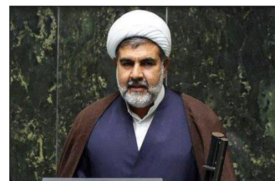
عضو کمیسیون قضائی و حقوقی مجلس طرح نشان‌دار کردن مالیات‌ها را ابزاری برای اقناع سازی مردم به پرداخت مالیات دانست و بر تأثیر مثبت آن در گسترش

۱۰۰ از محل هزینه‌کرد مالیات‌های پرداختی خود در پروژه‌های مشخصی مانند ساخت‌وساز، آموزش، بهداشت یا توسعه زیرساخت‌های مناطق محروم باعث بالا رفتن سطح اعتماد آنان به نظام مالیاتی و گسترش فرهنگ مالیاتی در کشور می‌شود. عضو کمیسیون قضائی و حقوقی مجلس با بیان اینکه این طرح به بهبود وضعیت مالیات‌ستانی در کشور کمک خواهد کرد، اظهار داشت: اجرای درست طرح نشان‌دار کردن مالیات‌ها می‌تواند به توسعه اقتصادی و اجتماعی مناطق محروم کمک شایانی کند و از این طریق توسعه متوازن در مناطق مختلف کشور برقرار شود.